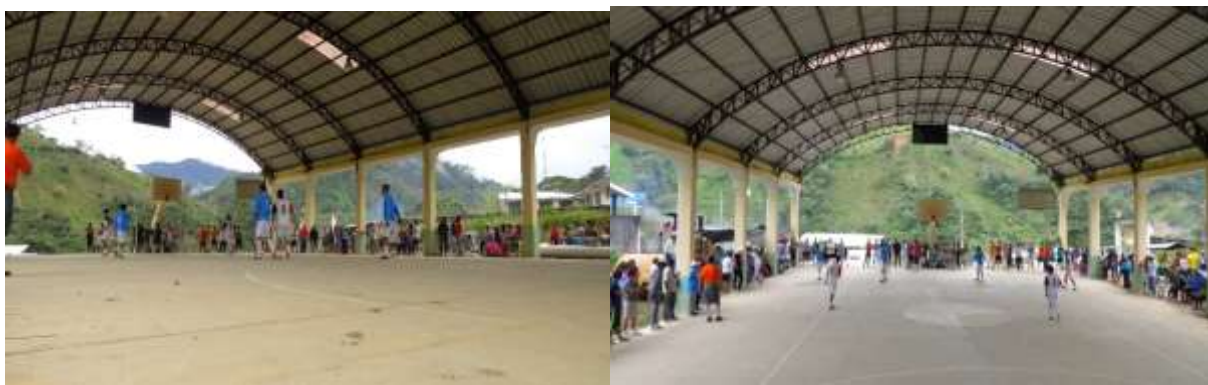
Imagen # 34 y 35: final de indor