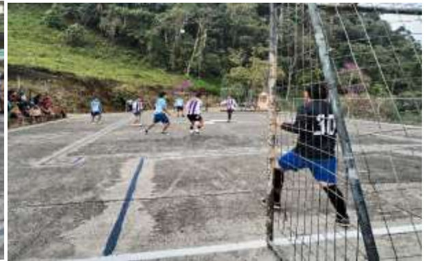
Imagen # 21 y 22: encuentros deportivos durante el proyecto (barrio de Los Laureles)