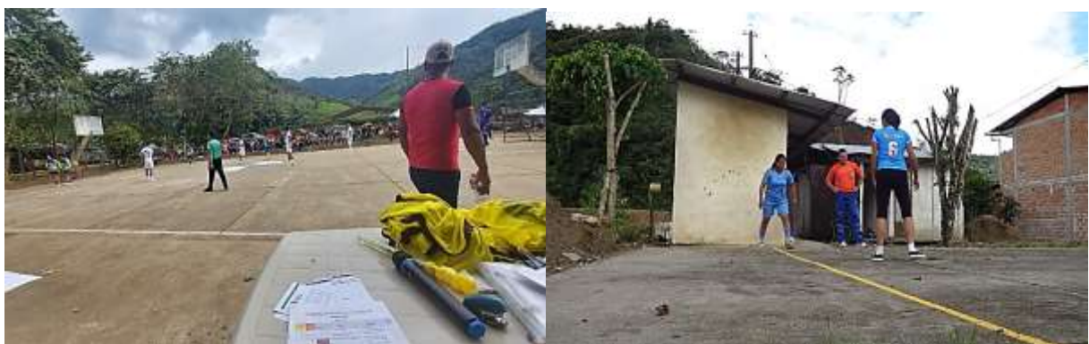
Imagen # 30 y 31: encuentros deportivos durante el proyecto (Puente Azul)