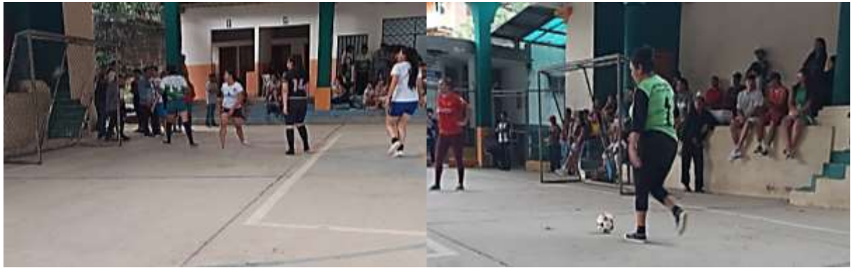
Imagen # 27: encuentros deportivos durante el proyecto (Nambija)