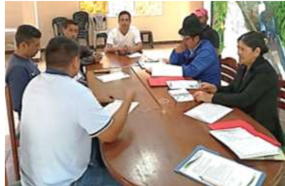
Imagen # 3,4 y 5: socialización del proyecto a los representantes de los equipos deportivos de la parroquia de San Carlos de las Minas, el mismo que se llevó a efecto en el salón del pueblo del GADPSCM.