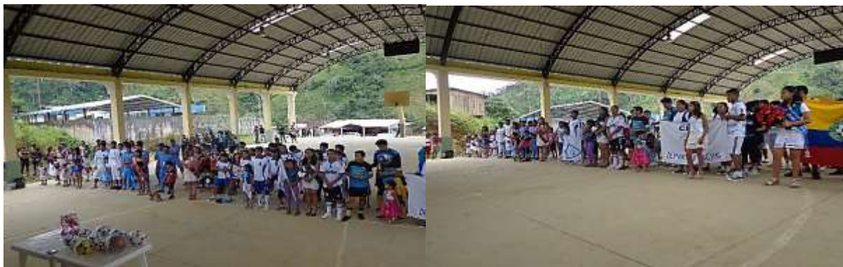
Imagen # 16: Elección de la señorita de deportes en representación de los equipos deportivos