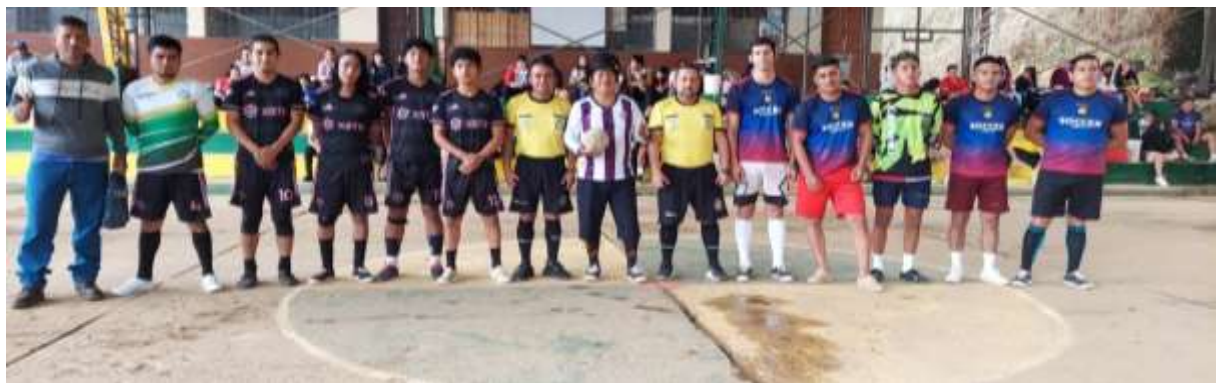
Imagen # 28 y 29: encuentros deportivos durante el proyecto (San Agustín)